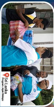
Sri Lanka Program Jajak Melayu